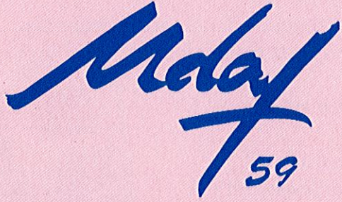
Illustration : Wiebke Petersen. Composition: Point Info Famille Douai

http://lillemetropole.point-infofamille59.fr